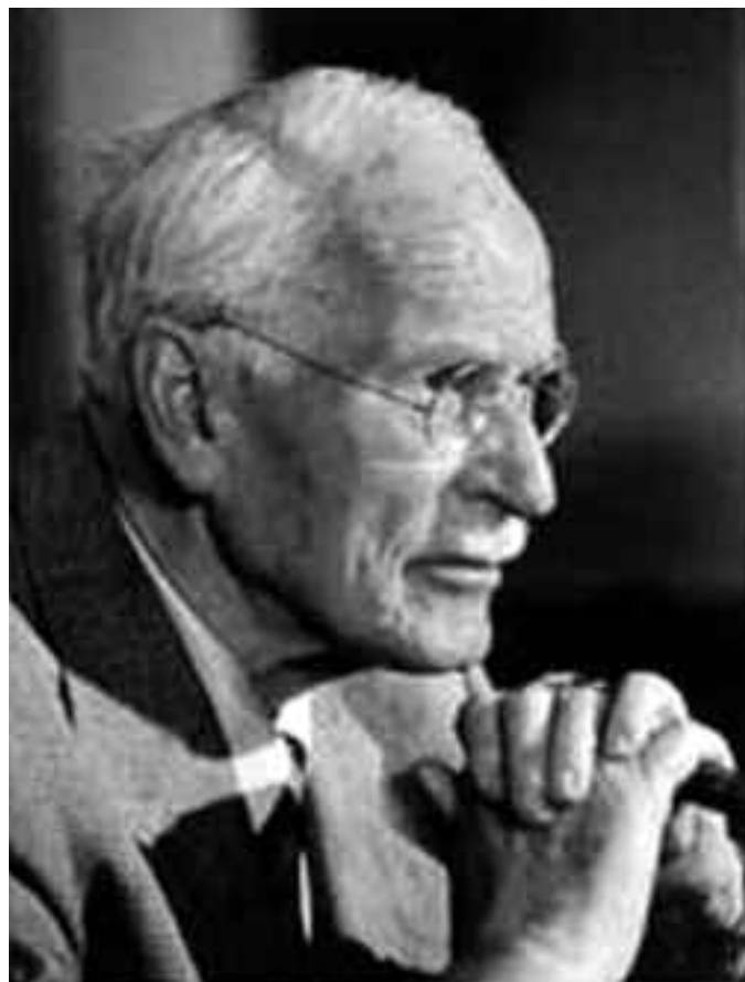
Carl Gustav Jung

Straordinari sono gli studi di Jung sugli eventi sincronici (premonizioni, veggenze e in generale tutti i fenomeni paranormali), che egli considera un'altra dimostrazione dell'esistenza dell'Inconscio Collettivo. Le categorie spazio-tempo sono artifici della mente, la Fisica delle nano particelle ha infatti dimostrato che il prima e il dopo non sono valori assoluti, ma relativi all'osservatore che, a sua volta, è soggetto a più variabili. Senza meno l'Inconscio è slegato da queste categorie "mentali" e allora accade che in particolari stati di abolizione della Coscienza (sogni, stati crepuscolari, trance, ecc...) ci si possa trovare in un "qui ed ora" che non ha inizio e fine, prima e dopo, al pari di un'immagine in un quadro e allora ci si può parare davanti quello che chiamiamo "futuro", ma che invero appartiene alla dimensione senza spazio e senza tempo che tutto comprende e che rappresenta l'Esperienza dell'Umanità, percepibile dall'Inconscio.