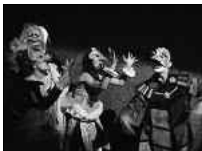
Un momento dello spettacolo che sottolinea la polemica bruniana contro la passività intellettuale