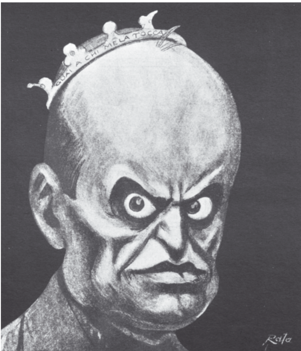
Celebre caricatura di Mussolini apparsa nel 1925 sull'ultimo numero del giornale satirico L'ASINO soppresso da fascismo